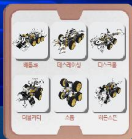
익스트림 배틀 XB