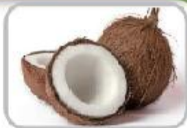
용로로 쿠키로! 신통방통 코코넛