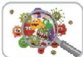
알고 이기재, 색깔과 바이러스