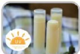
산뜻하게 뿌려요, 선히크림