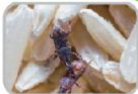
잘을 좋아하는 팔바구미