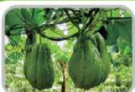
아삭아삭 차요테 장아찌