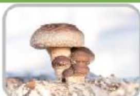
표고도 똑똑, 나도 똑똑