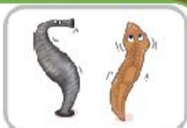
분사소 돌라나리아와 잘먹 거머리