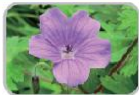
로즈 게리움, 구몬노