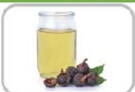
나무에 열린 세제, 노프넨