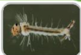
귀서문 불침객 모기 퇴치하기