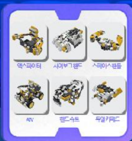
익스트림 웨어러블 XW