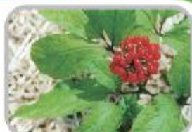
천년을 이어 온 고려인삼