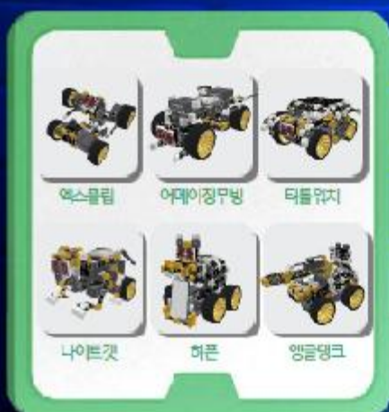
익스트림 센서&디스플레이 S0

기본활동으로 로봇을 완성하고 창의활동으로 나만의 새로운 로봇을 만들어요! 다양한 아날로그 센서를 사용하여 나만의 웨어러블 조종기를 만들어요!