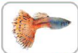
화려한 색에 반하다, 구피