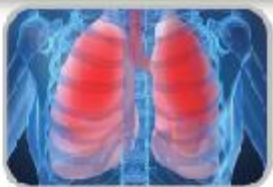
우리 몸의 산소통, 허파