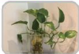
물로 키우볼까, 수경 재배