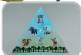
먹이 피라미드 무드등