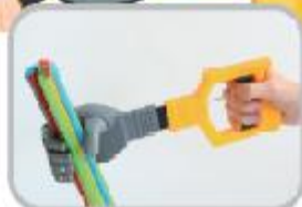
섬세한 손의 비밀