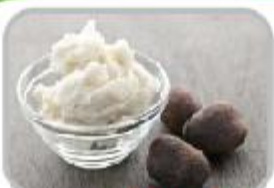
죽죽레오, 바오바브 크림