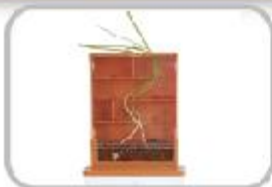
햇빛 찾아 미로 탈출