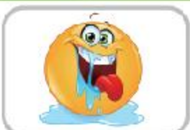
네 입속에 보물 창고, 쉼