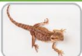
마기도 턱수염에 비어디드 드래곤